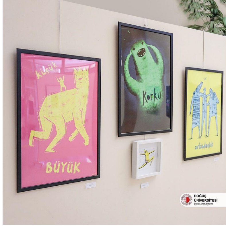
Tablo 5. asarımda Kolektif Hareketler Zirvesi: Kamu için Tasarlamak