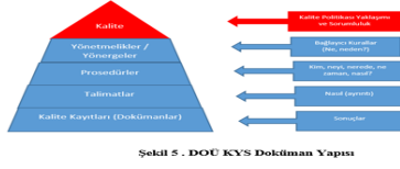
Şekil 5. DOÜ KYS Doküman Yapısı

DOÜ KYS ile ilgili tüm faaliyet ve dokümanların kamuoyuyla paylaşılacağı bir web sitesi aktif durumdadır. Bu site aynı zamanda öğrenci ve tedarikçilerin de şikayet, görüş ve önerilerini bildirmelerine fırsatt verecek şekilde tasarlanmıştır.